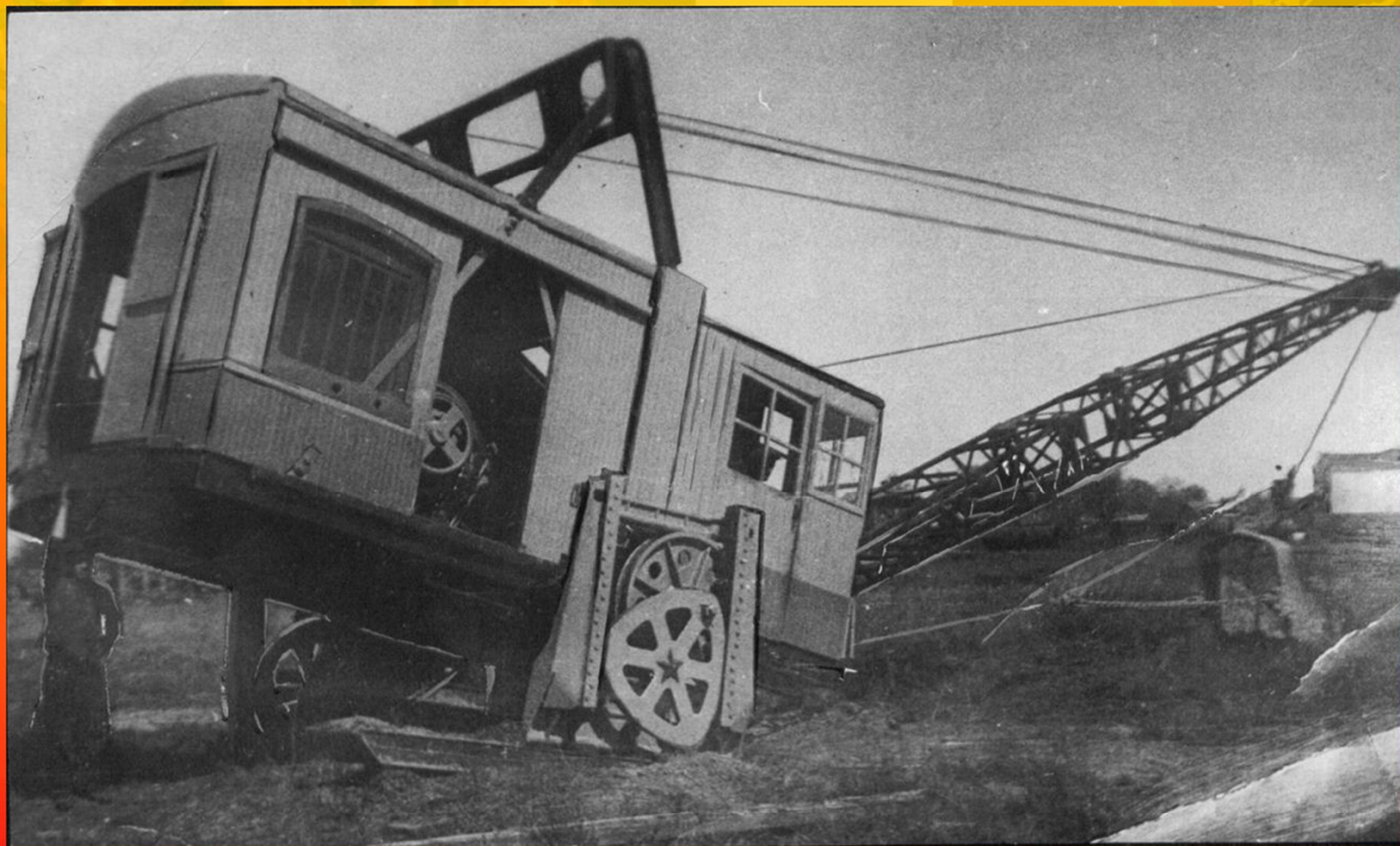
Первый в Европе «шагающий» экскаватор, собранный на заводе «Рабочий металлист»