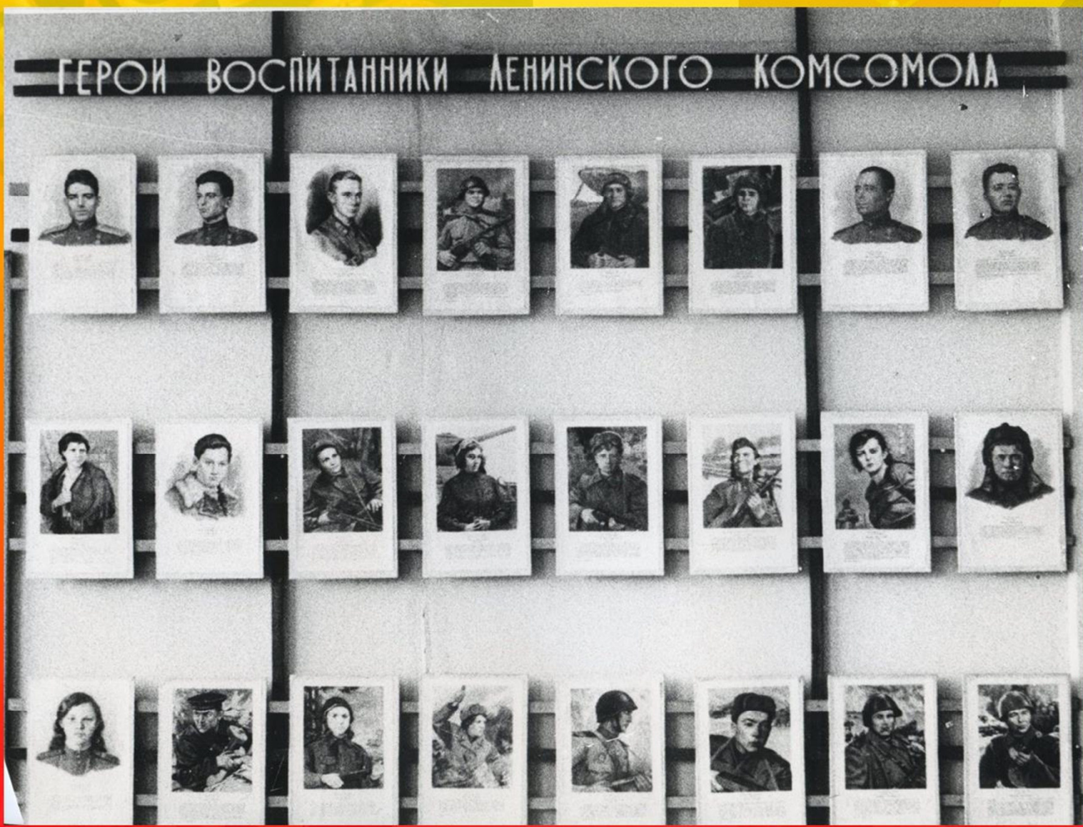
Герои – воспитанники Ленинского комсомола