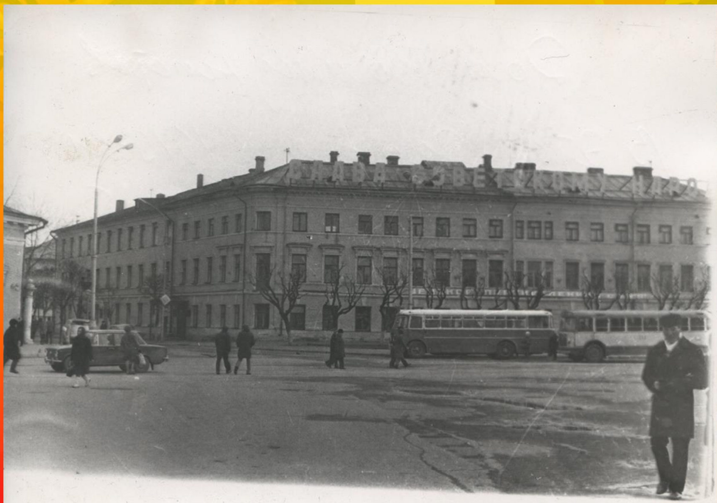
«Дом коммунистов», в котором в 1919–1920 гг. располагались губком РКП(б) и губком РКСМ