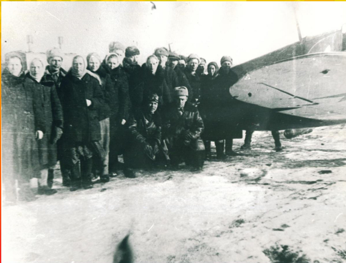
Костромичи на фоне самолёта, построенного на собранные ими средства