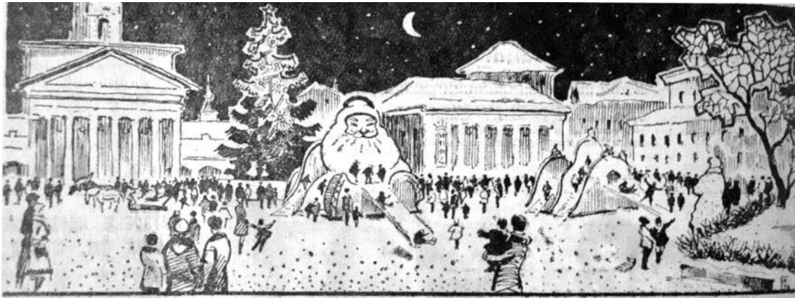
Кострома. Новогодняя елка на площади Революции.

Меняются, уходят в прошлое устаревшие общественно-экономические формации, «забирая с собой» отжившие свой век памятные события. Наступают другие времена, одаривая человечество неизвестными ранее датами, рождаются новые люди, которые начинают их отмечать. И только один-единственный праздник пережил годы, столетия и продолжает свое победное, величественное и яркое шествие.